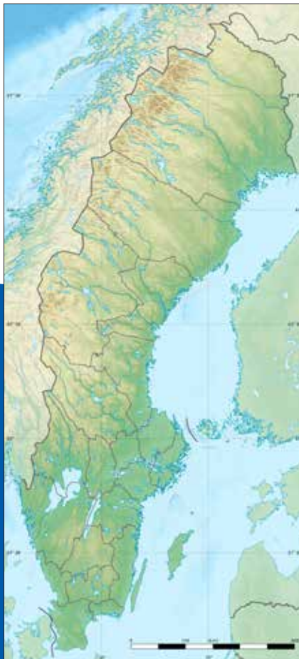
Eric Gaba – Wikimedia Commons user: Sting

Die Heimfahrt war trotz eines ausgefallenen Zuges auf den wir drei Stunden warten mussten (und der dann trotzdem nicht kam) und anderen echt unangenehmen Zwischenfällen kein Problem, weil wir alle mit einem breiten Grinsen im Gesicht die Fahrt beenden konnten und uns auf dem Heimweg einiges erzählen. ■