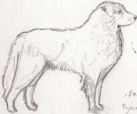
„Patou“ Pyrenäen- berghund (Frankreich)