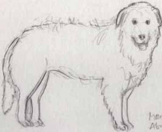
Marone Abruzzo (Italien)

Herdenschutzhunde im Einsatz. Innerhalb einer Herde sind mindestens zwei bis viele Herdenschutzhunde. Es gibt verschiedene Rassen dieser HSH, die in verschiedenen Ländern eingesetzt werden. Sie unterscheiden sich etwas in Aussehen und auch Charakter. Die zwei abgebildeten Hunde sind die in der Schweiz offiziell anerkannten HSH-Rassen.